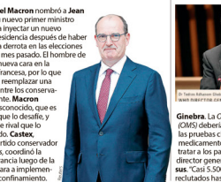
Paris Emmanuel Macron nombró a Jean Castex como su nuevo primer ministro mientras intenta inyectar un nuevo impulso a su presidencia después de haber sufrido una dura derrota en las elecciones municipales del mes pasado. El hombre de 55 años es una nueva cara en la escena política francesa, por lo que lo está eclipsando. Castex, miembro del partido conservador Los Republicanos, coordinó la reapertura de Francia luego de la pandemia obligada a implementar medidas de confinamiento.

Gobierno francés quiere reinterventarse ante la crisis