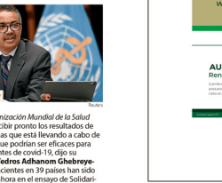
Ginebra. La Organización Mundial de la Salud (OMS) deberá recibir pronto los resultados de las pruebas clínicas que está llevando a cabo de medicamentos que podrían ser eficaces para tratar a los pacientes de covid-19, dijo su director general Tedros Adhanom Ghebreyesus. "Casi 5.500 pacientes en 39 países han sido reclutados hasta ahora en el ensayo de Solidari-

OMS espera resultados de sus primeros fármacos